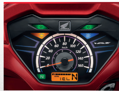
Meter with LCD

ไฟท้ายโฉบเฉี่ยว ส่องสว่างเห็นชัดทุกมุมมอง แม้ระยะไกล ด้วยรีเฟลิกเตอร์ด้านล่าง มั่นใจทุกสภาพการขับขี่ ลงตัวกับมือจับหลังดีไซน์แตร่ง