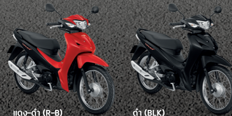
แดง-ดำ (R-B) ดำ (BLK)

รุ่นสตาร์ทเท้า ดิสก์เบรกหน้า ล้อซี่ล้อ AFS110KSFN TH