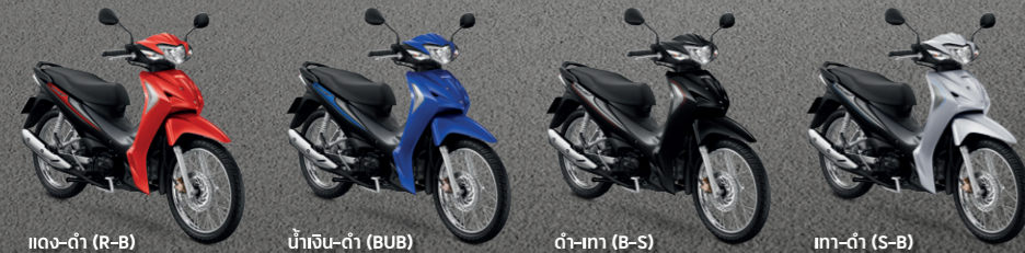
แดง-ดำ (R-B) น้ำเงิน-ดำ (BUB) ดำ-เทา (B-S) เทา-ดำ (S-B)

รุ่นสตาร์ทมือ ดิสก์เบรกหน้า ล้อซี่ล้อ AFS110MSFN TH