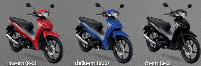
แดง-เทา (R-S) น้ำเงิน-เทา (BUS) ดำ-เทา (B-S)

รุ่นสตาร์ทมือ ดิสก์เบรกหน้า ล้อแม็ก AFS110MCFN TH