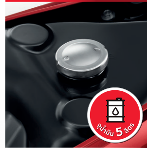
Big Fuel Tank

มั่นใจเป็นที่ 1 ด้วยสวิตช์กุญแจนิรภัย ล็อกง่าย พร้อมม่านปิดช่องกุญแจให้คุณอุ่นใจ