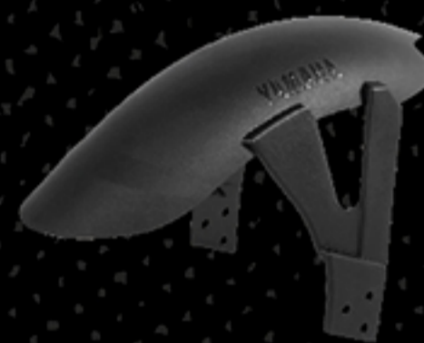
บังโคลนหลัง สีดำ