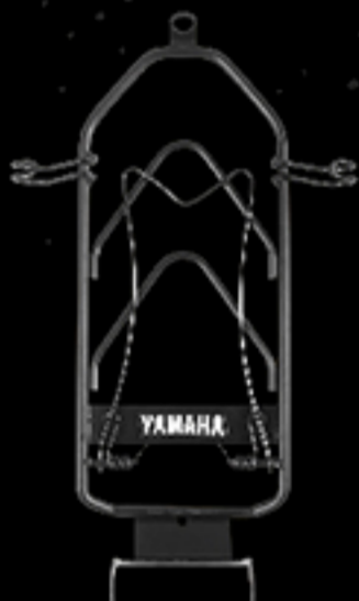
กันล่าย สีดำ