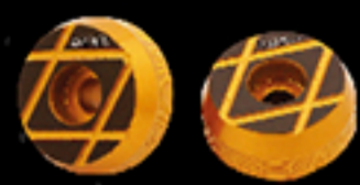
ชุดจุกปิดปลายแฮนด์ สีทอง