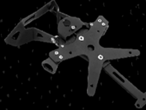
ชุดยึดแผ่นป้ายทะเบียน