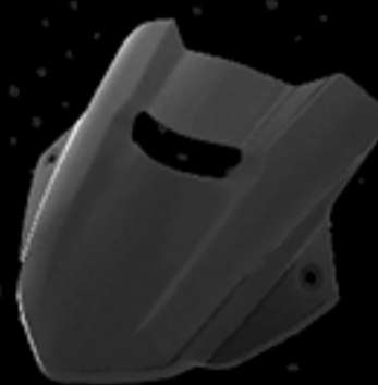
บังไมล์สปอร์ต สีควีนบิวรี่