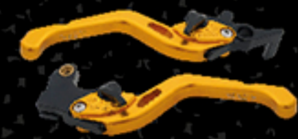
ชุดมือเบรก-มือคลัตช์ สีทอง

แต่งให้สปอร์ต...เร้าใจสุดๆ กับชุดแต่งและอะไหล่ที่จากยามาฮาในราคาพิเศษ