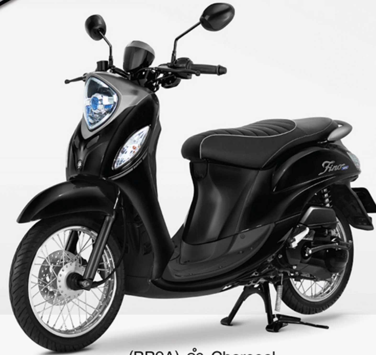
(BB9A) ดำ Charcoal