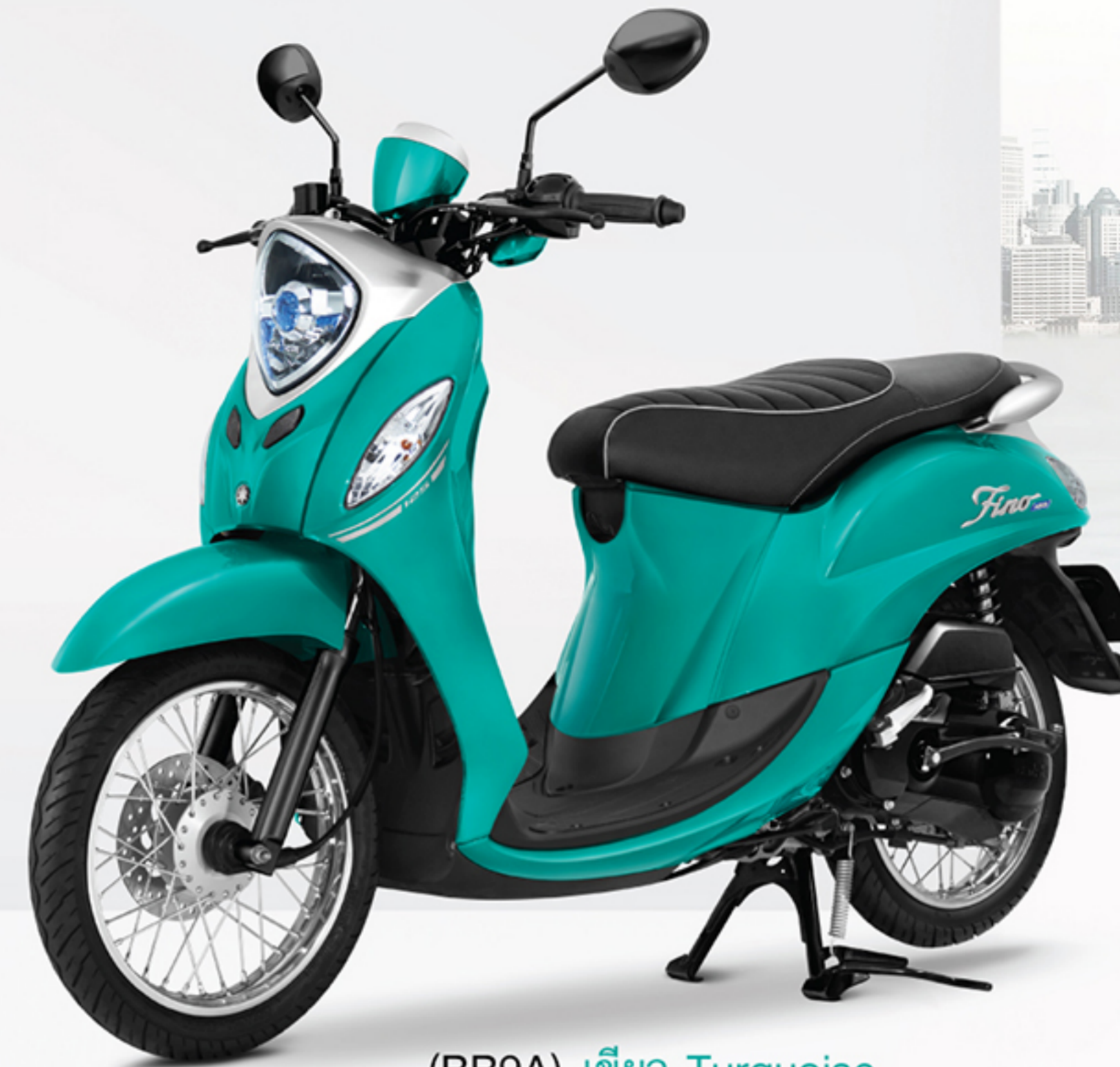
(BB9A) เขียว Turquoise