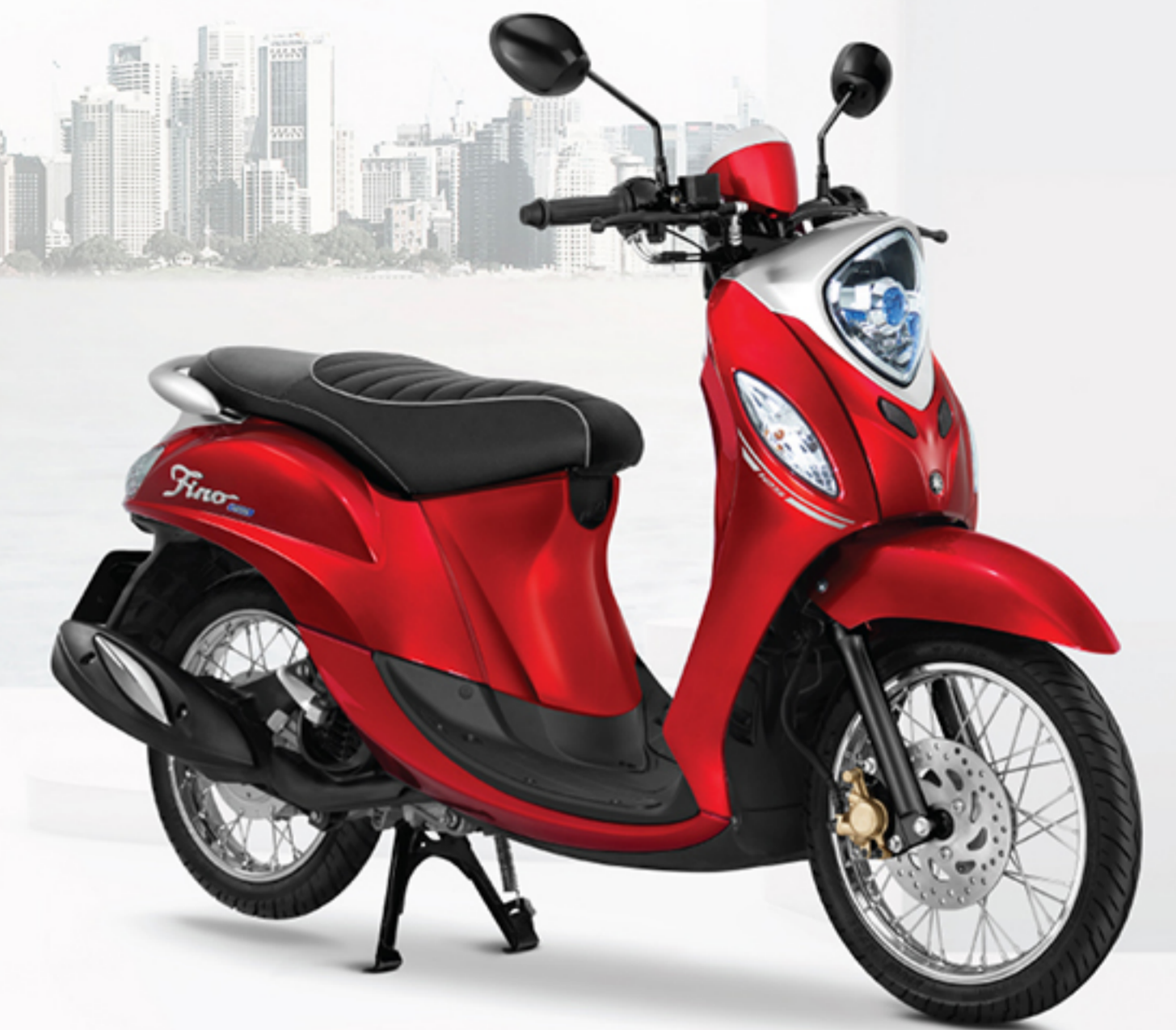
(BB9A) แดง Ruby