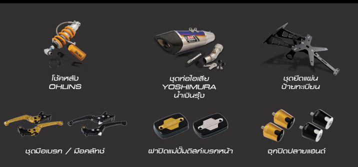
โช๊คหลัง OHLINS