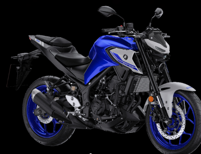
สีน้ำเงิน - เทา Deep Purplish Blue Metallic