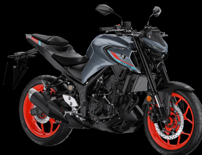
สีเทา Pastel Dark Grey